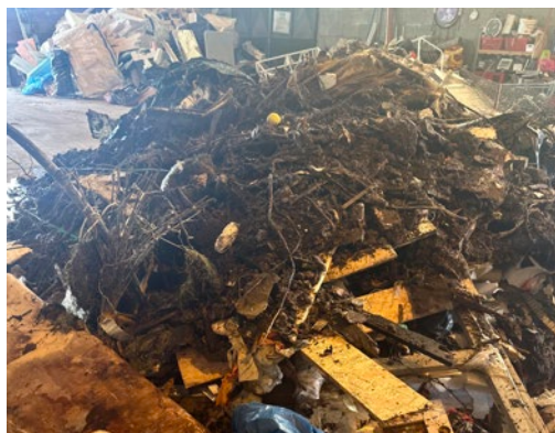
ZMIEŠANÁ ZEMINA, KONÁRE, ODPADOVÉ DREVO A INÉ MATERIÁLY