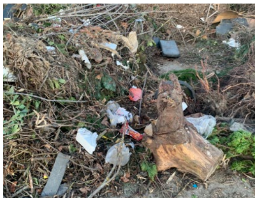
PLASTOVÉ OBALY Korene a pne zbierať osobitne