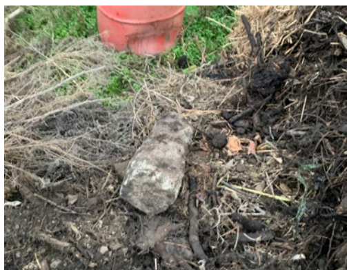
BETÓNY A KAMENIVO