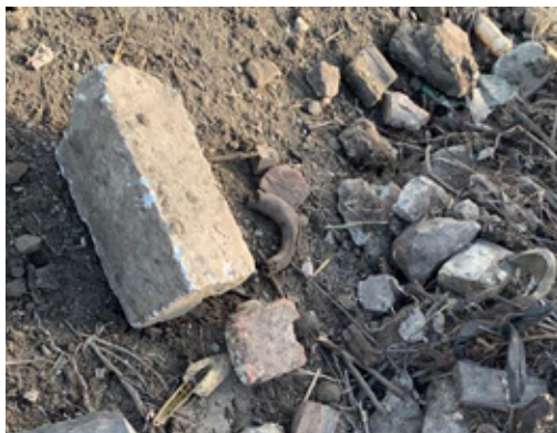
BETÓNY A KAMENIVO